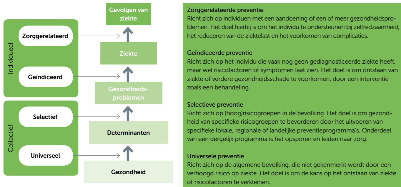
Figuur: indeling van preventie naar doelgroepen

preventie van verzakking en incontinentie. Maar zeker ook cryopreservatie van eicellen of embryo's bij oncologische aandoeningen van jonge vrouwen om de gevolgen van ziekte te beperken.